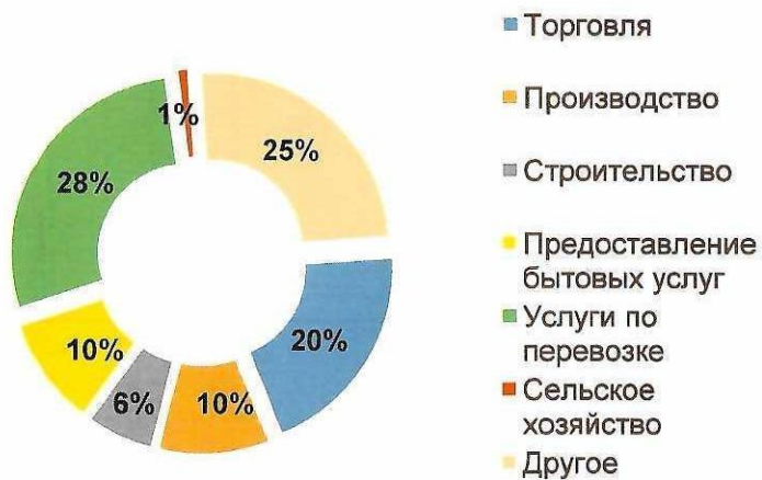
Объем выдач по секторам